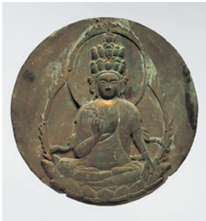
十一面観音懸仏