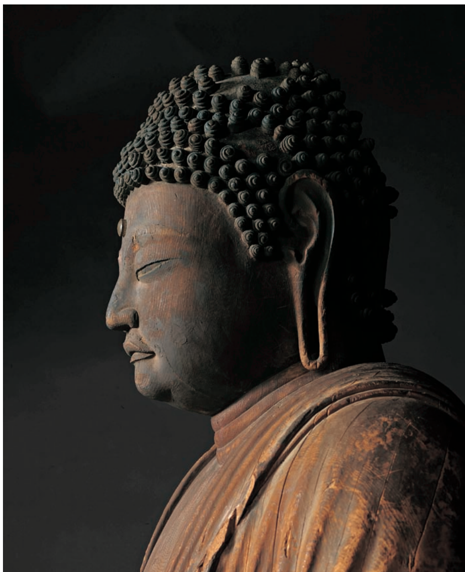
国宝 薬師如来立像(奈良・元興寺)