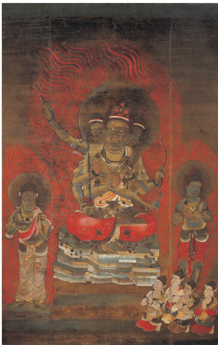
●五大尊像のうち降三世明王像(岐阜・来振寺)