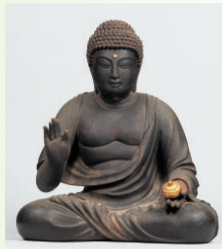
重要文化財 薬師如来坐像（京都・薬師寺〔和束町〕）