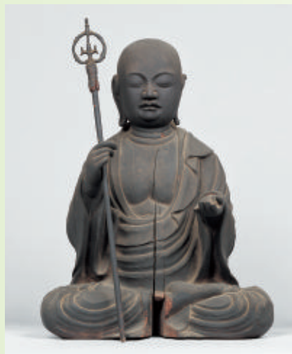
木津川市指定文化財 地藏菩薩坐像（京都・西教寺〔木津川市〕）

重要文化財 十二神将立像のうち子神・丑神・寅神・卯神・午神・酉神・亥神 (東京・静嘉堂文库美術館) 画像提供：(公財)静嘉堂 DNPartcom