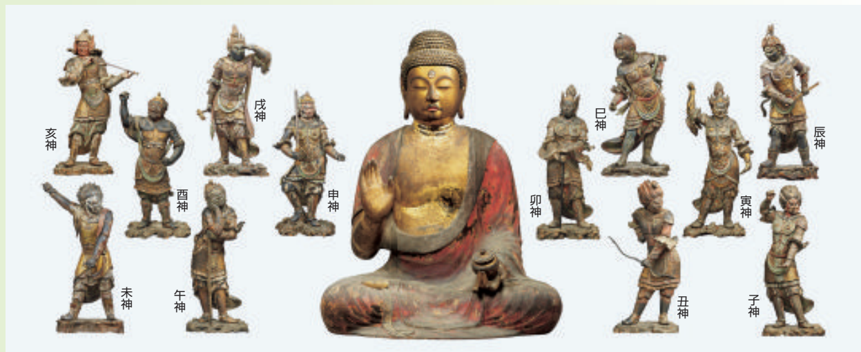
重要文化財 薬師如来坐像（京都・浄瑠璃寺〔木津川市〕） 展示期間：7月9日(日)～8月6日(日)

重要文化財 十二神将立像のうち辰神・巳神・未神・申神・戌神 (東京国立博物館)