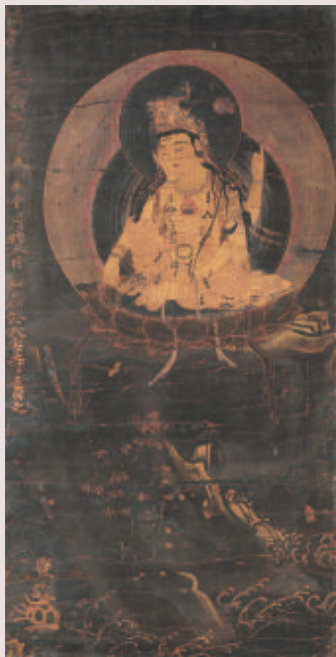
図1 如意輪観音像 ハーバード美術館蔵(2014.146)

残念ながら文頭の元号は薄れて見えないが、「五年」の干支が「丁丑」となる中世の元号は、安土桃山時代の天正五年（一五七七）あるいは、鎌倉時代の建保五年（一二二七）に限られ、本図の絵画表現から、本図の成立が鎌倉時代前半に遡るとは考え難く、年記は前者の天正五年に絞られる。とすればこの記述は、この金泥銘または絵画そのものを、天正五年に豊