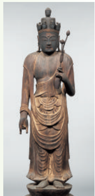
重要文化財 十一面観音立像 (京都・海住山寺〔木津川市〕)