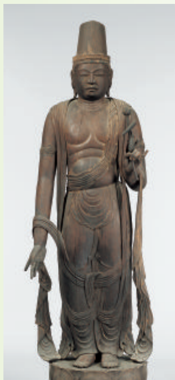
重要文化財 菩薩形立像 (京都・常念寺〔精華町〕)