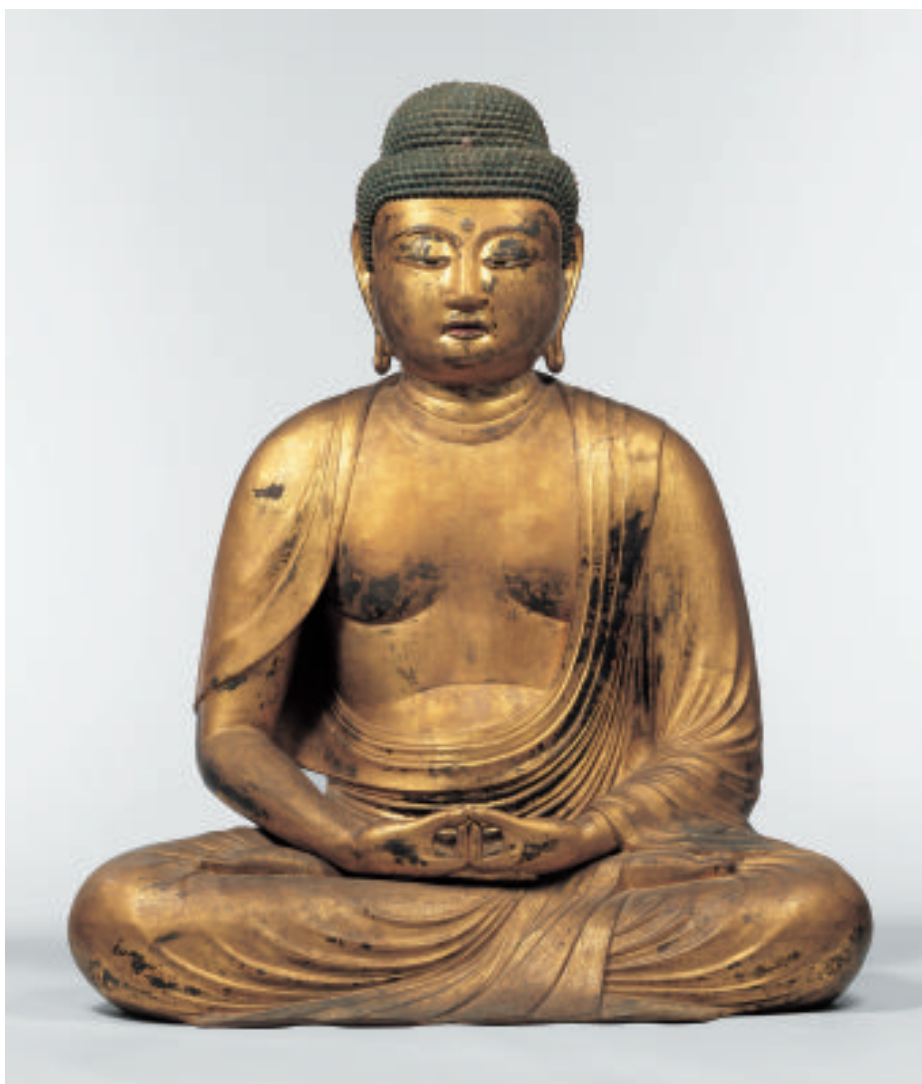
国宝 阿弥陀如来坐像 9軀のうち その8（京都・浄瑠璃寺〔木津川市〕）