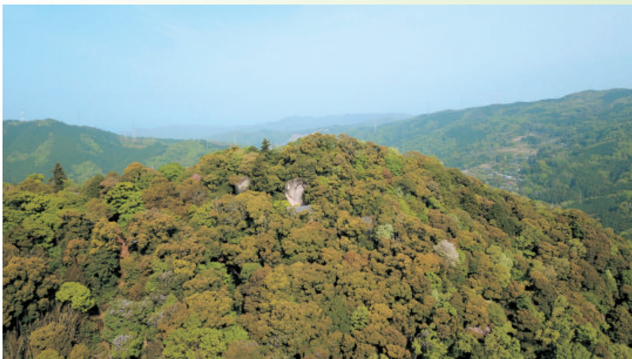
笠置寺弥勒崖仏 遠景

本展は、五か年に及ぶ保存修理が完成した浄瑠璃寺九体阿弥陀像のうち二軀を修理後初公開するとともに、その優美な姿を寺外で拝することのできるまたとない機会となります。さらに南山城とその周辺地域の寺社に伝わる仏像や神像を中心に、絵画や典籍・古文書、考古遺品などを一堂に展観することで、この地に花開いた仏教文化の全貌に迫ります。多彩な作品を通して南山城のゆたかな歴史と文化を再認識していただくとともに、緑深いこの地域にいまなお受け継がれる聖地の息づかいをご堪能ください。